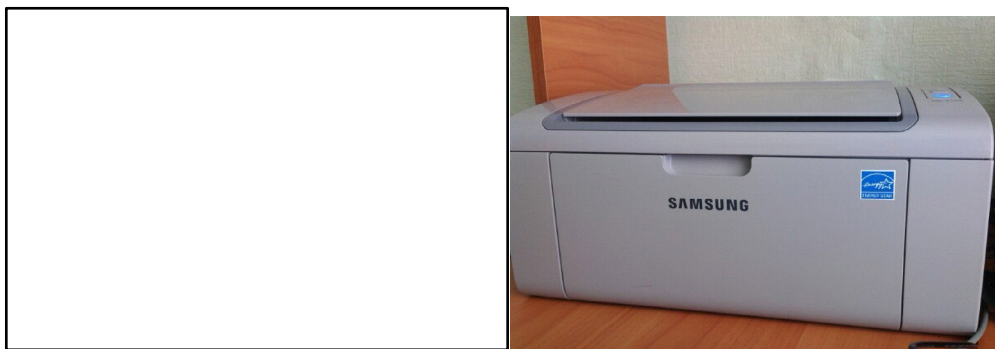
Рисунок 1–Принтер ML-2160

В таблице 2 описана характеристика принтера ML-2160