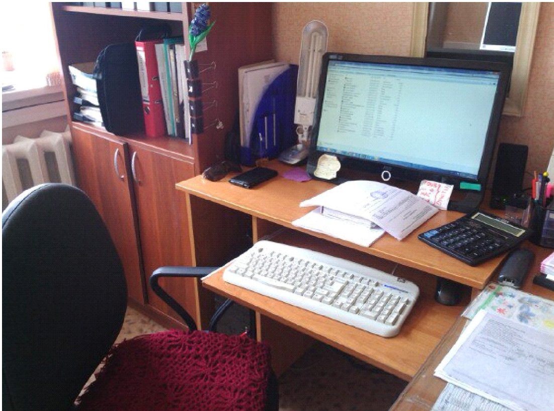
Рисунок 8 – Рабочее место

Рабочее место оператора ЭВМ обеспечено правильным освещением и удобным креслом. Так же имеется клавиатура, мышь и необходимые программы для работы.