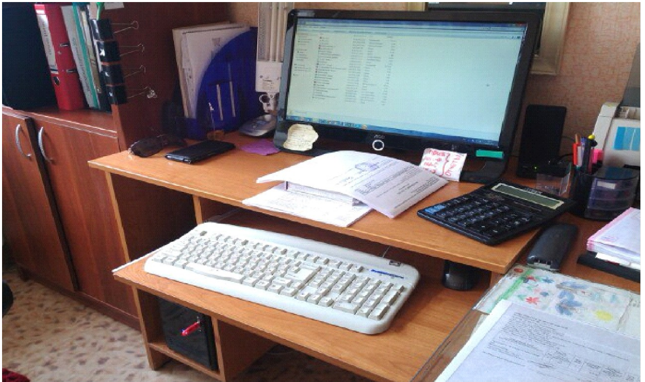
Рисунок 4 – Моноблок Asus ET2031IUK

В таблице 5 описана характеристика моноблока.