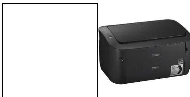
Рисунок 2 – Принтер Canon i-SENSYS LBP6030B

На рисунке 2 представлен принтер Canon i-SENSYS LBP6030B.