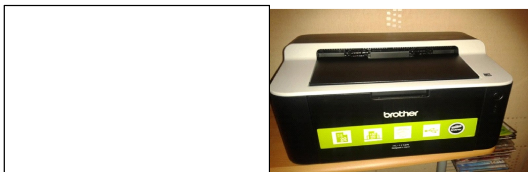
Рисунок 3 – Принтер Brother HL-1112R

На рисунке 3 представлен принтер Brother HL-1112R.