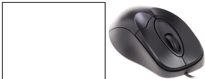
Рисунок 6 – Мышь проводная DEXP CM-406BP

На рисунке 6 представлена компьютерная мышь DEXP CM-406BP.